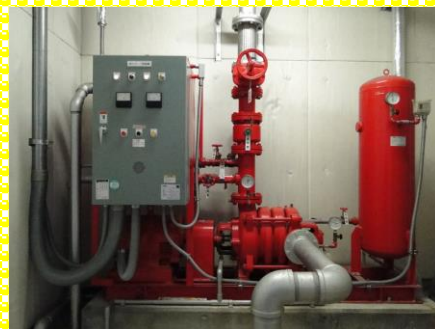
ポンプの起動・停止を遠隔操作 正常に稼働しているかは、カメラの映像で確認