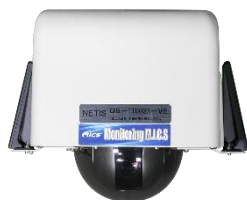
モニタリングミックス(カメラ)