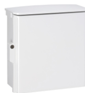
多接点制御装置(出力最大8接点)